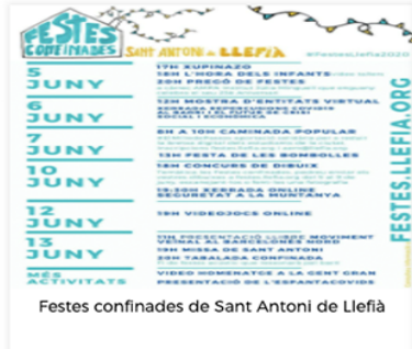
Festes confinades de Sant Antoni de Llefià